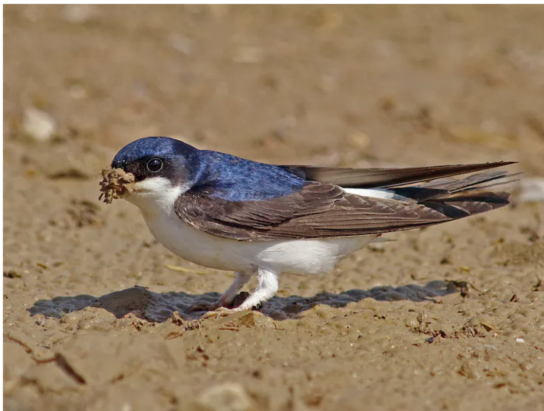
Hussvala Delichon urbicum